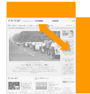
Tandem Ad (Kombination von Standardwerbeformen)