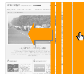
Expandable (auf Klick, für alle Standardwerbe- formen möglich)

*schematische Darstellung, die genaue Platzierung kann abweichen